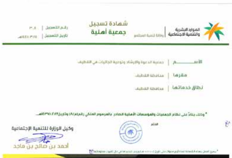
شهادة ترخيص الجمعية