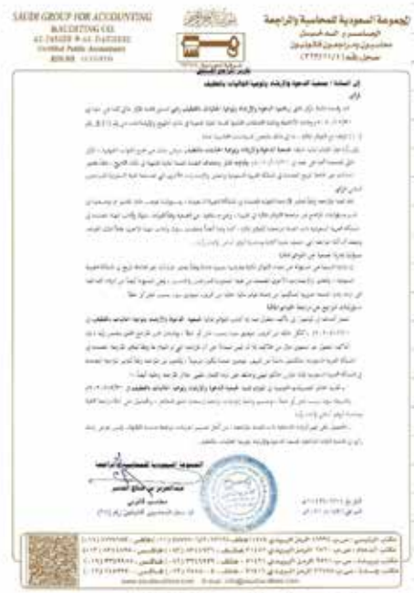
تقرير المراجع القانوني