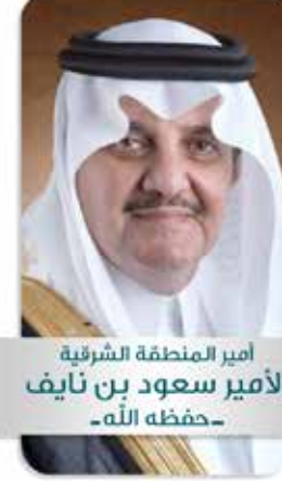
أمير المنطقة الشرقية الأمير سعود بن نايف -حفظه الله-