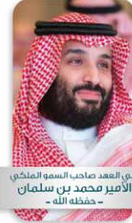
ولي العهد صاحب السمو الملكي الأمير محمد بن سلمان -حفظه الله-