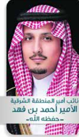
نائب أمير المنطقة الشرقية الأمير أحمد بن فهد -حفظه الله-