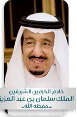
خادم الحرمين الشريفين الملك سلمان بن عبد العزيز -حفظه الله-

شكر الله عطاءكم .. وأيد جهودكم في خدمة الإسلام والمسلمين