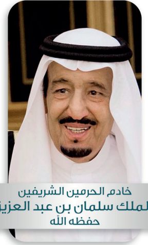
خادم الحرمين الشريفين الملك سلمان بن عبد العزيز حفظه الله

شكر الله عطاءكم، وأيد جهودكم في خدمة الإسلام والمسلمين