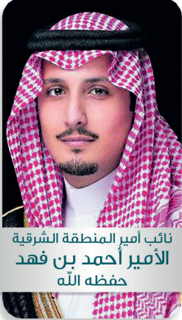
نائب أمير المنطقة الشرقية الأمير أحمد بن فهد حفظه الله