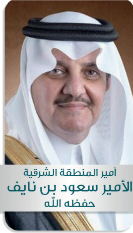
أمير المنطقة الشرقية الأمير سعود بن نايف حفظه الله