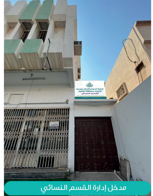
مدخل إدارة القسم النسائي