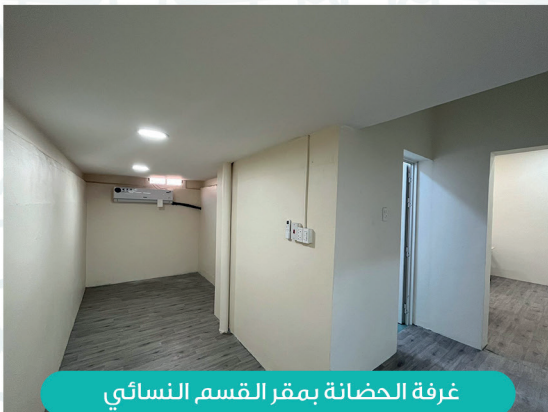
غرفة الحضانة بمقر القسم النسائي