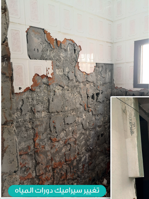
تغيير سيراميك دورات المياه