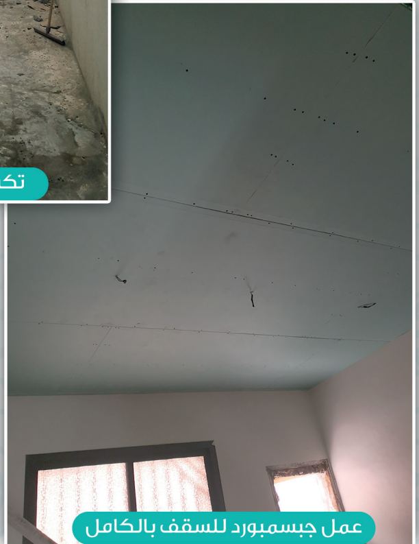
عمل جبسبورد للسقف بالكامل