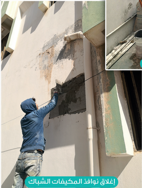
إغلاق نوافذ المكيفات الشباك