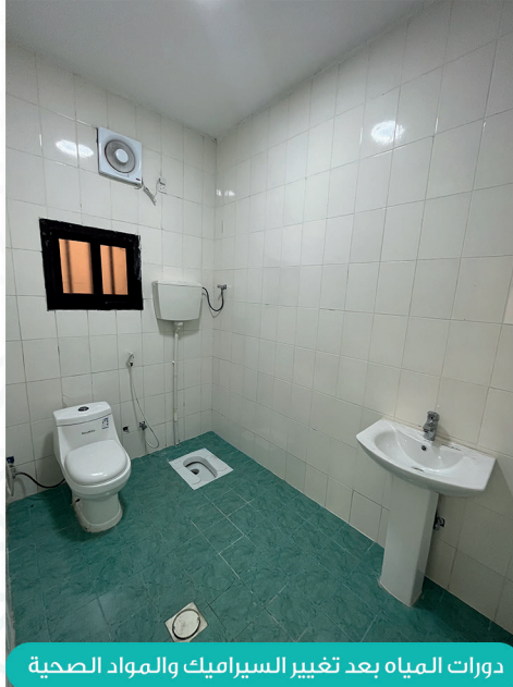
دورات المياه بعد تغيير السيراميك والمواد الصحية