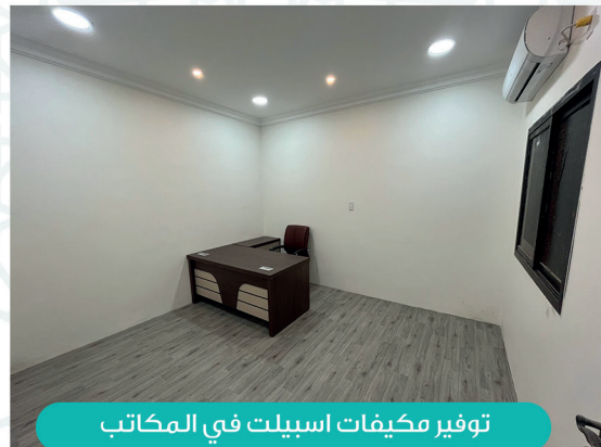
توفير مكيفات اسبيلت في المكاتب