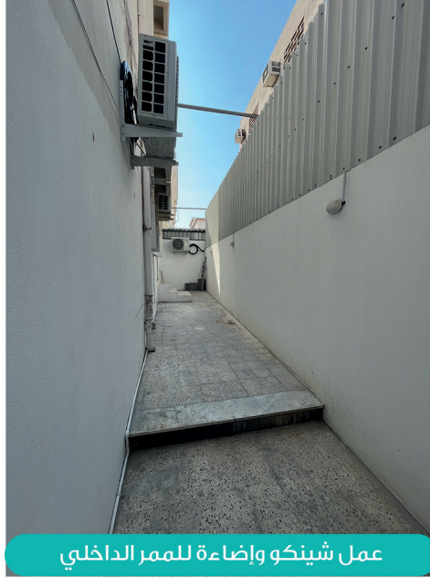
عمل شينكو وإضاءة للممر الداخلي