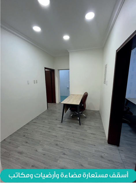
أسقف مستعارة مضاءة وأرضيات ومكاتب