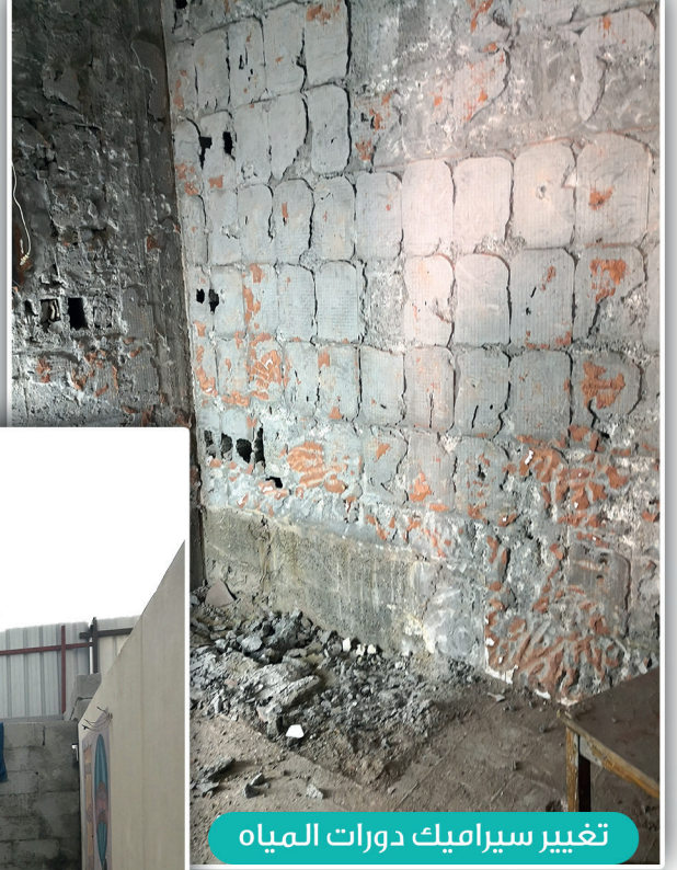
تغيير سيراميك دورات المياه