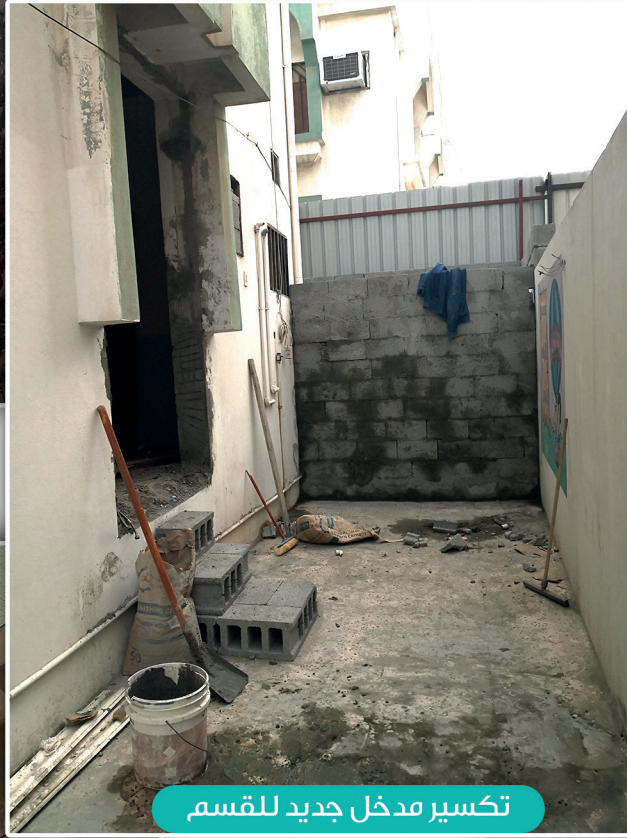
تكسير مدخل جديد للقسم