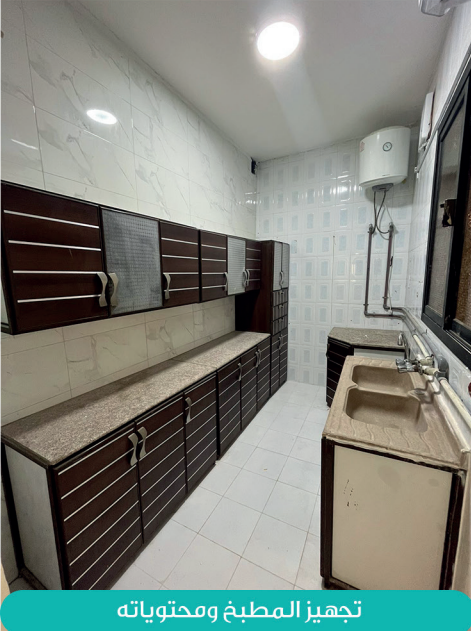
تجهيز المطبخ ومحتوياته